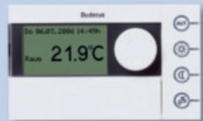
Bedieneinheit Logamatic RC35

Das Heizen mit Niedertemperaturtechnik ist zwar sparsam, stellt aber auch hohe Anforderungen an das Material der Kessel. Denn bei niedrigen Temperaturen im Kessel kann sich zeitweise Kondenswasser bilden, das die heizgasberührten Flächen angreift. Darum verwenden wir für die Heizkessel der Serie Logano einen Spezial-Grauguss, der sehr widerstandsfähig gegenüber kurzzeitigem Kondensatanfall ist. Ein weiterer Vorteil: Dieser Werkstoff lässt sich leicht in jede gewünschte Form bringen. Das ermöglicht es uns, Brennraum und Heizflächen perfekt an Flammgeometrie und Wärmestrom anzupassen. So wird die Wärme optimal an das Heizwasser übertragen und Sie profitieren von einer höheren Energieausbeute.