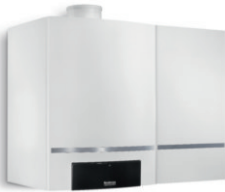
Logamax plus GB162 mit 40-Liter-Schichtenladespeicher

Der Logamax plus GB162 spart nicht nur eine Menge Energie, sondern auch Platz. Sein überaus kompaktes Format ist ein Riesenvorteil für Sie, denn jeder gesparte Zentimeter bringt umso mehr Freiheit bei der Wahl des Aufstellungs-ortes. Das Gerät passt in viele Nischen und Ecken und überzeugt durch denkbar einfache Montage. Und das besondere Plus: Auf Wunsch verwöhnt Sie der Logamax plus GB162 auch noch mit sehr hohem Warmwasserkomfort.